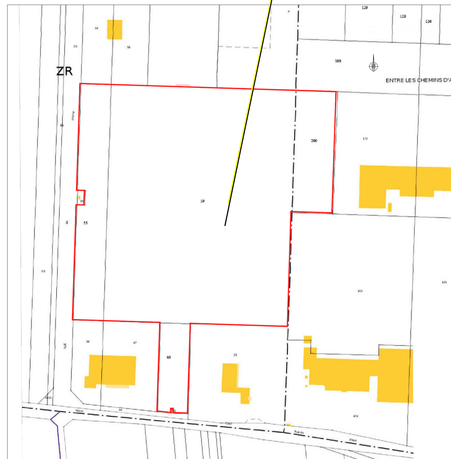
PLAN CADASTRE (ECH.: 1/2000) PARCELLE CADASTRALE section BA 39 (1 RUE ALAIN COLAS), D'APRES WWW.CADASTRE.GOUV.FR

TERRAIN CONSIDERE RUE DU CHAMP MACRET CADASTRE PARCELLES ZR N° 46, 55, 59 ET ZB N°200 SUPERFICIE : 61 895 m 2